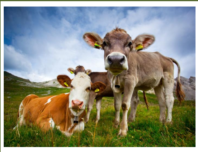
ВЕДЕНИЕ ЛИЧНОГО ПОДСОБНОГО ХОЗЯЙСТВА