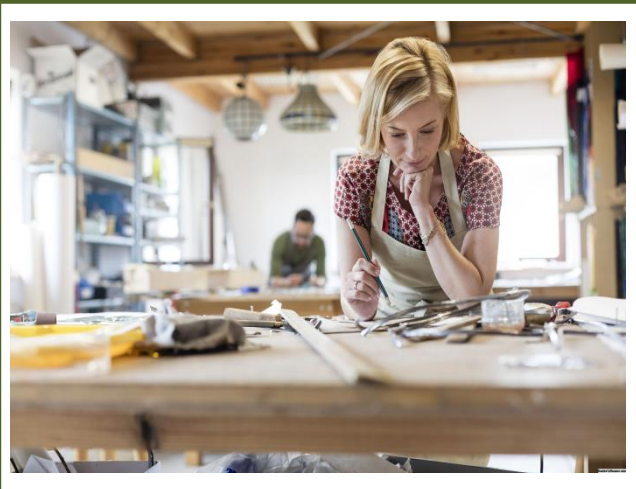
СОЗДАНИЕ СВОЕГО ДЕЛА